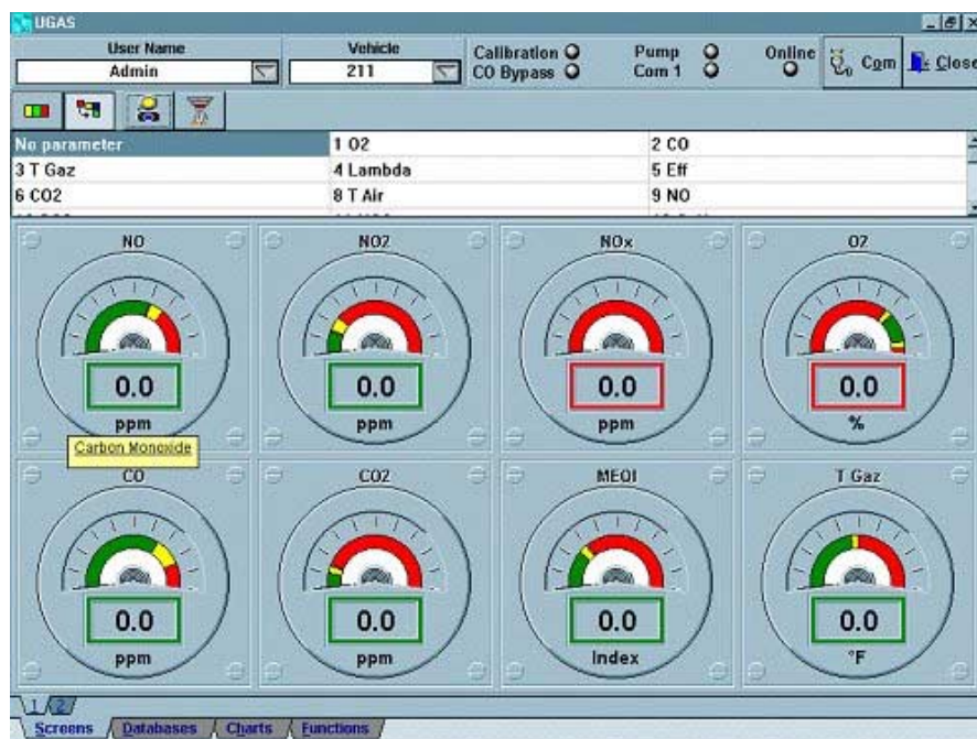
Figure 6. Fenêtre du logiciel de contrôle UGAS