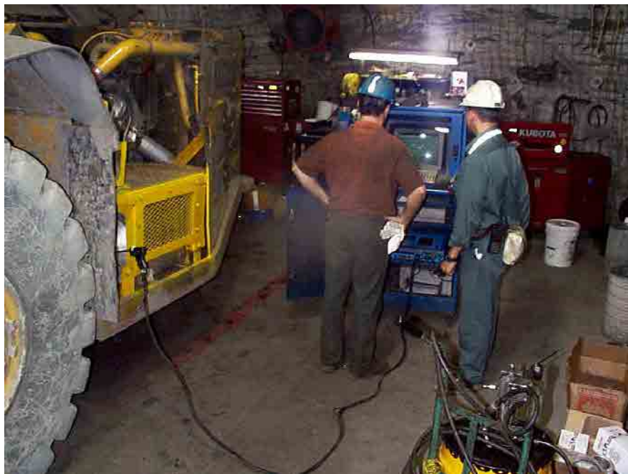
Figure 5. Échantillonnage direct des émissions à l'aide de l'appareil UGAS/ECOM