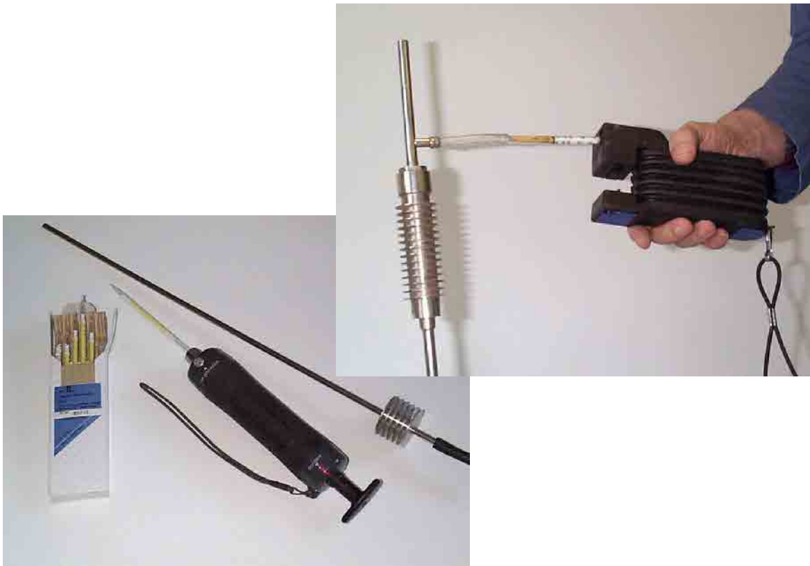
Figure 7. Échantillonnage du monoxyde de carbone à l'aide de tubes colorimétriques