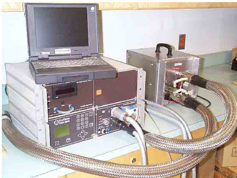
Figure 4. Instrument Nanomet