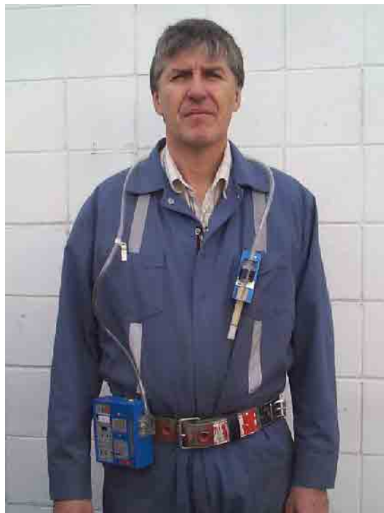
Figure 2. Système d'échantillonnage des poussières