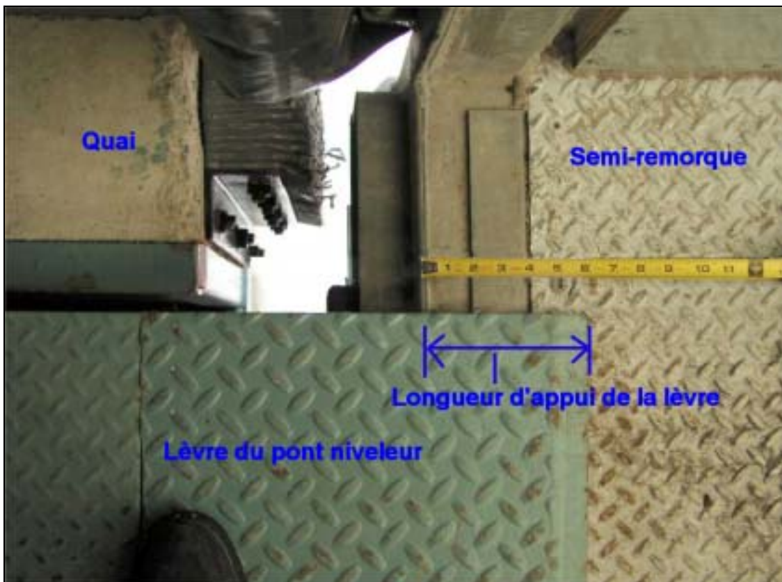
Figure 2. Longueur d'appui de la lèvre