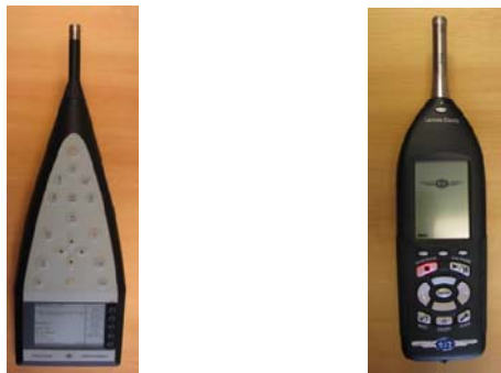
Figure 2: Sonomètres utilisés pour les mesures de bruits ambiants (gauche, Bruël & Kjaer 2260; droit, Larson Davis 831)

Un sonomètre a été utilisé lors de chacune des prises de mesure pour mesurer le bruit ambiant. Il s'agit du sonomètre de marque Larson Davis, modèle 831 ou du sonomètre de marque Bruel & Kjaer, modèle 2260. Tous deux sont des appareils de type 1.