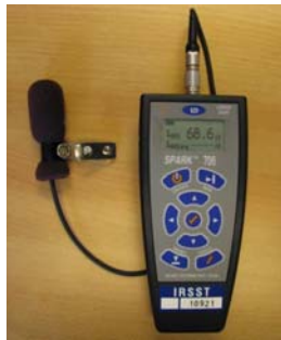
Figure 1: Dosimètre Larson Davis (Spark 706) utilisé pour les mesures

Les dosimètres utilisés, au nombre de deux, sont de marque Larson Davis, modèle Spark 706. Il s'agit de dosimètres reconnus pour les mesures d'exposition au bruit, respectant les pré-requis de la norme (CSA 2006)-Z107.56-F06 (Méthodes de mesure de l'exposition au bruit en milieu de travail). Tel qu'illustré à la figure 1, les mesures ont été réalisées avec une bonnette anti-vent pour protéger le microphone de possibles éclaboussures d'eau.