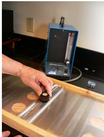
Figure 5 : Méthode de l'IRSST

Les avantages et inconvénients de ces trois méthodes sont mentionnés au tableau 2.