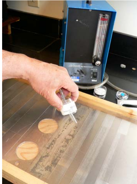
Figure 4 : Méthode de l'ASPEC