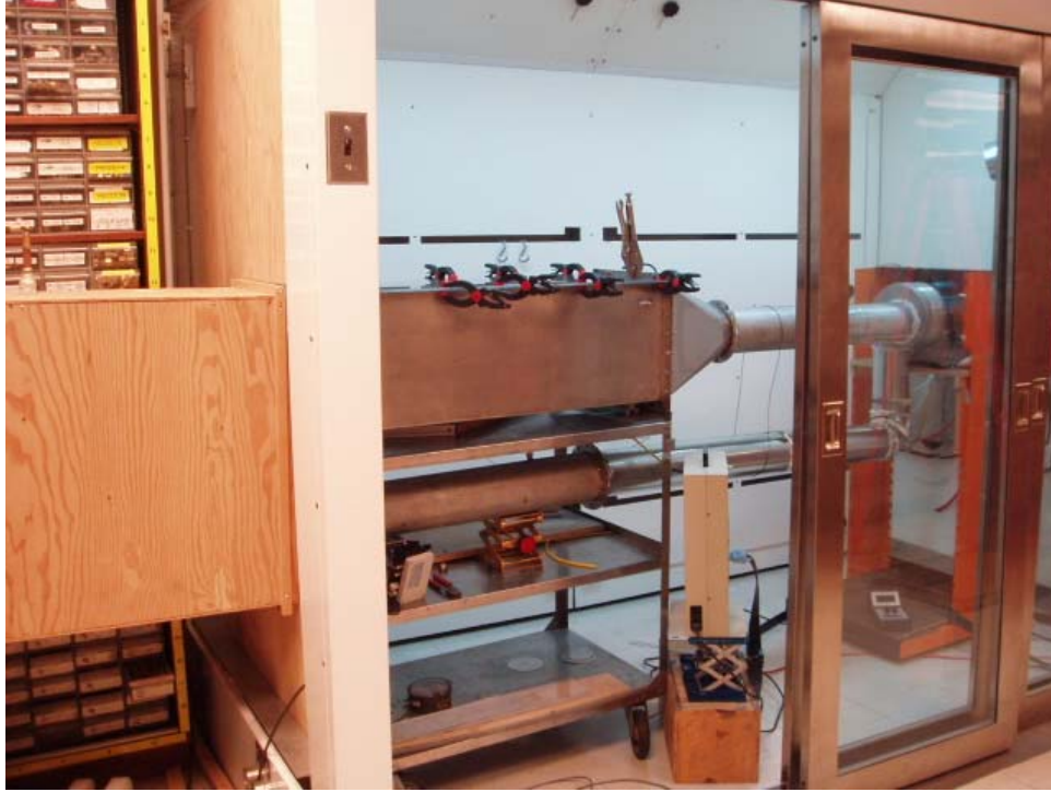
Figure 1 : Chambre d'empoussièrement actuelle