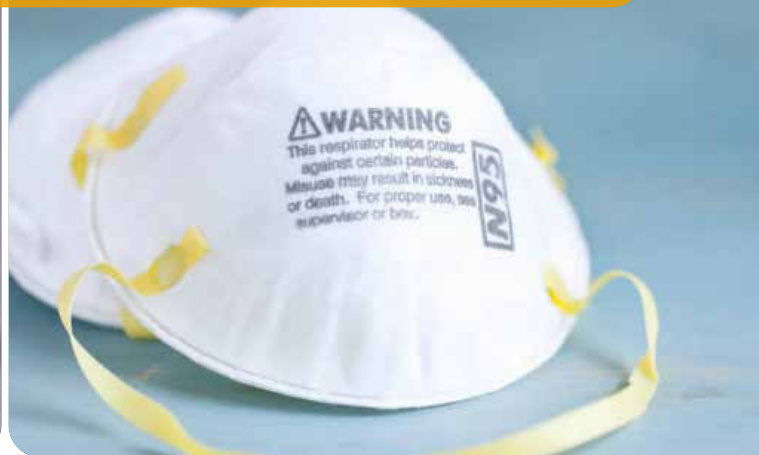
Deux modèles d'APR-N95 en milieux de soins.