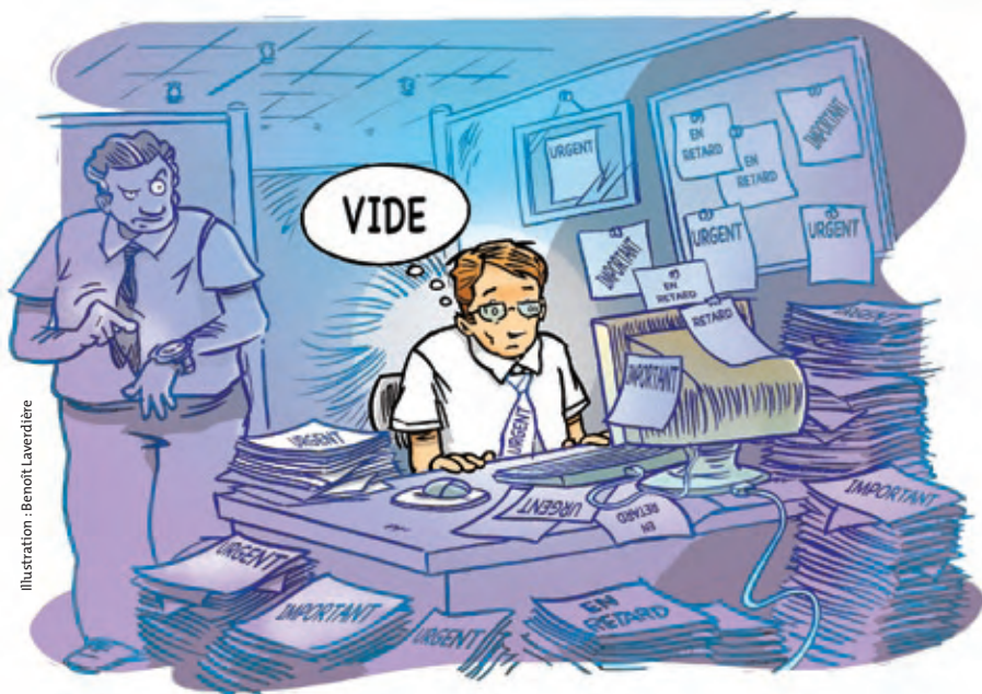
Illustration : Benoit Laverdière