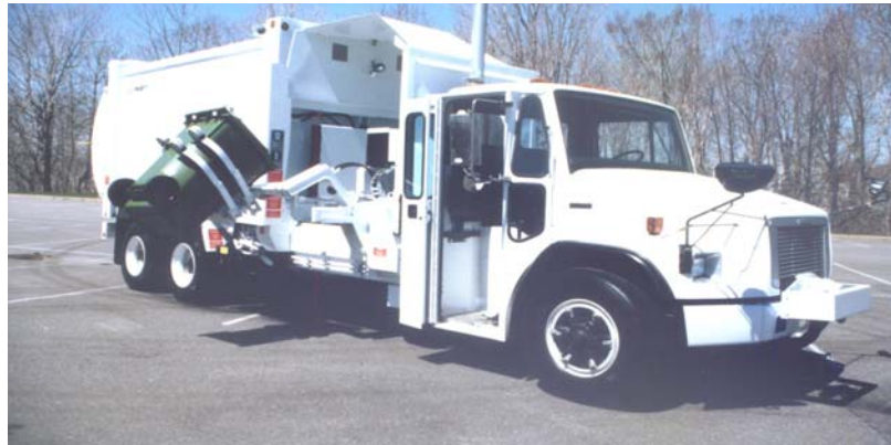
Figure 1: Camion avec bras assisté

la modification du type de collecte semble donc être la solution la plus intéressante. L'utilisation de camions avec bras assisté est présentement la réponse idéale pour éviter l'exposition aux bioaérosols (réf. figure 1). Dans ce type de collecte, le chauffeur n'est plus en contact avec la poubelle mais actionne uniquement de la cabine le bras qui fait tout le boulot. L'exposition semble donc être éliminée.