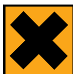
Xi - Irritant

Selon la directive 67/548/CEE de la Communauté Européenne, le CP est classé « Irritant – Irritant pour les yeux ». Les étiquettes des contenants doivent afficher le symbole ci-dessous et être accompagnées de la phrase de risque « Irritant pour les yeux » et du conseil de prudence « Conserver hors de la portée des enfants » (71).